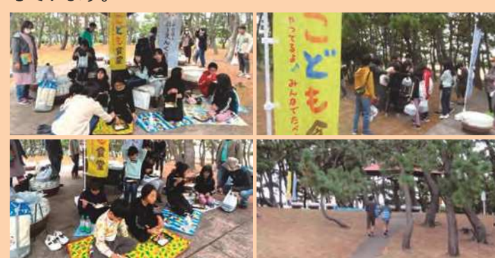
次はどここの食堂に行こうかな・・・次回もお楽しみに♪

今回は、林小学校区の「はやしこどもカフェ」に行ってきました。 SDGsの学習や工作など、こどもたちが楽しみながら豊かな経験ができる居場所づくりをしています。 活動の後は、スタッフ手作りのお弁当😊 コロナ禍により、一時的にテイクアウト型で実施していましたが、10月からは望海浜公園にて皆で一緒に食べる屋外型のこども食堂を実施しています。 明石の海を感じながらの食事は、より一層美味しく感じますね。これからも、たくさんのこどもたちの参加を楽しみにしています。